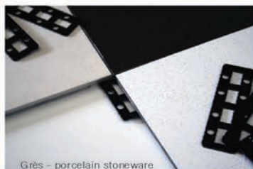
Grès - porcelain stoneware

The assembled system is immediately walkable, revealing itself as the ideal solution for new buildings, BIO ARCHITECTURE, as well as for minimally invasive restructurings and setting ups of temporary spaces.