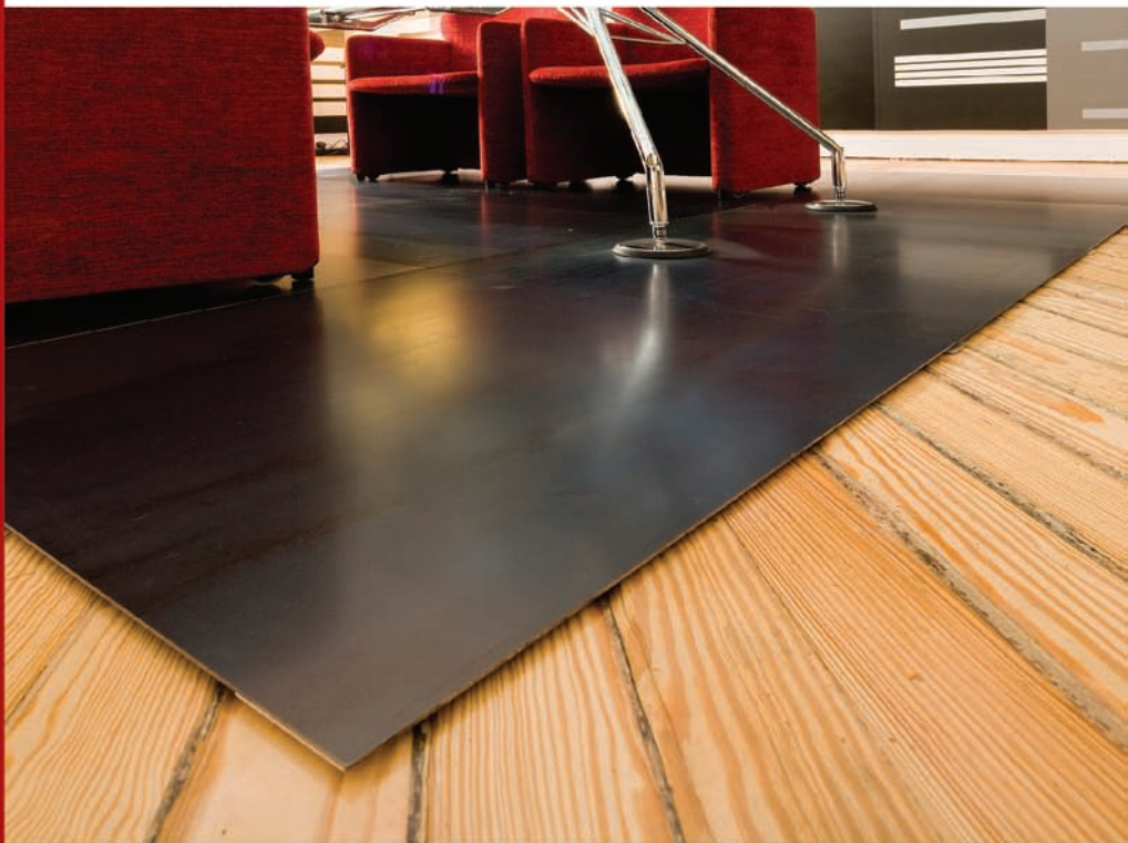
Istallazione - Finitura Acciaio Calamina | Calamine Steel - AD&AMadrid