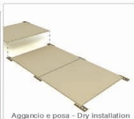
Aggancio e posa - Dry installation