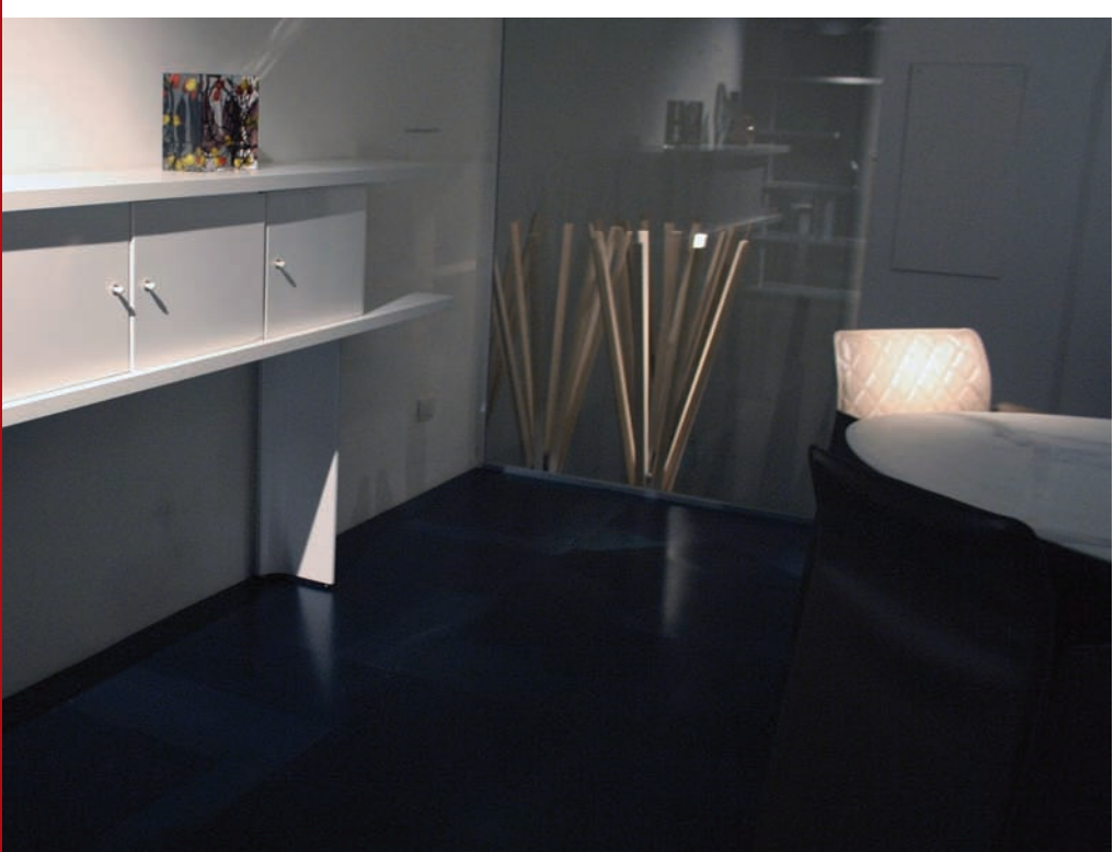
Istallazione - Finitura Acciaio Calamina | Calamine Steel - Cerruti Baleri - Milano