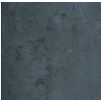
ME1 - calamina