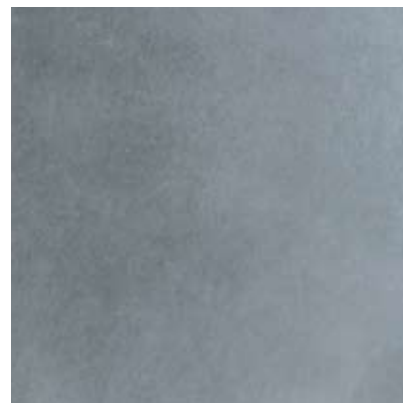
ME5 - acciaio inox 304 liscio ME6 - acciaio inox 430 liscio