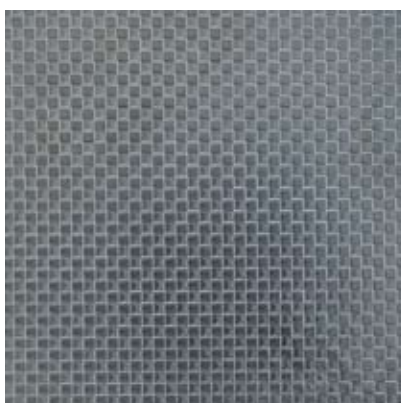
ME9 - acciaio inox 304 dama ME10 - acciaio inox 430 dama