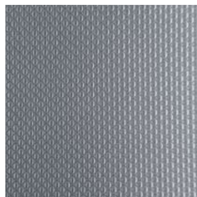
ME11 - acciaio inox 304 tela di lino ME12 - acciaio inox 430 tela di lino