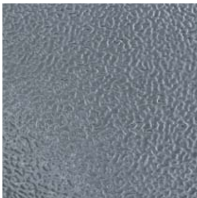
ME3 - acciaio inox 304 goffrato ME4 - acciaio inox 430 goffrato