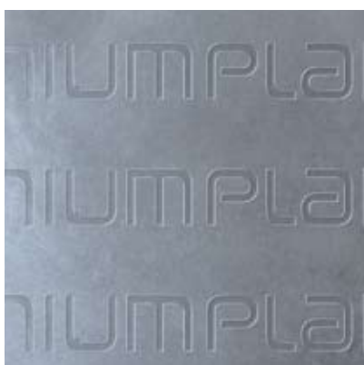
acciaio inox 304 personalizzato